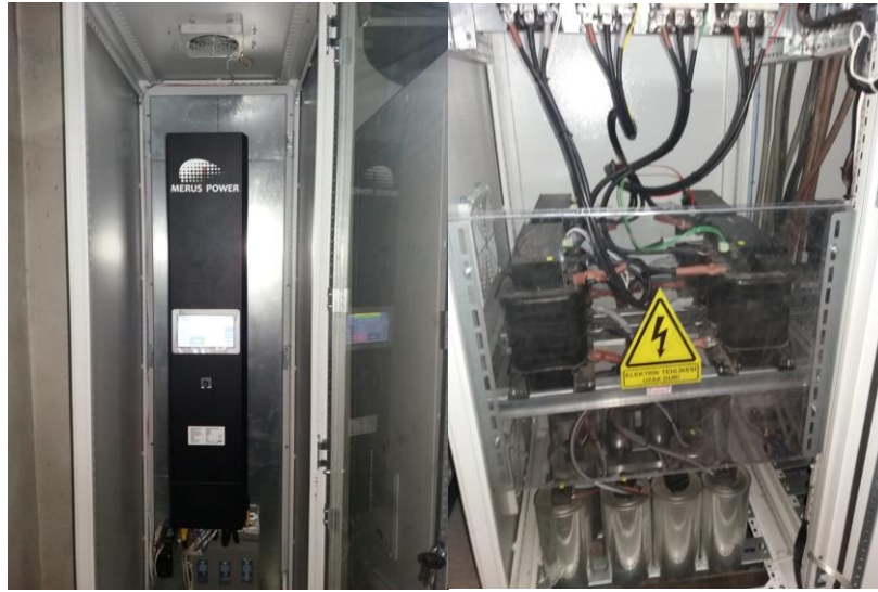
MERUS POWER AKTİF HARMONİK FİLTRE UYGULAMASI

Özel Megapark Hastane işletmesinde kurulan Güç Kalitesi sistemi 16.06.2019 tarihinde devreye alınmış olup sorunsuz ve en iyi şekilde görevini yerine getirmektedir.